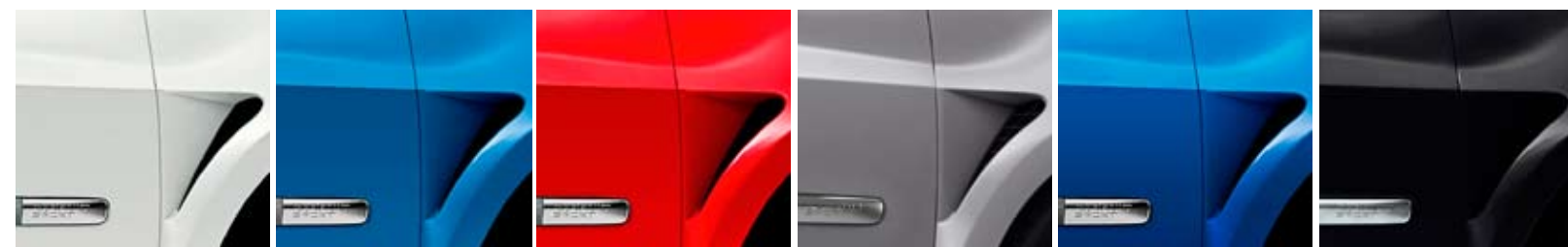
БЕЛЫЙ ЛЕД (OV 369) СИНИЙ МАТОВЫЙ (OV J45) КРАСНЫЙ МАТОВЫЙ (OV NNF) ТЕМНО-СЕРЫЙ МАТОВЫЙ (OV KNQ) СИНИЙ (TE RNC) ЧЕРНЫЙ (TE GNA)